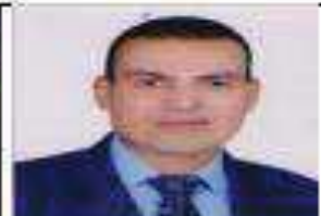
أ.د. ناصر مكاوى عودة رئيس قسم الآثار المصرية القديمة