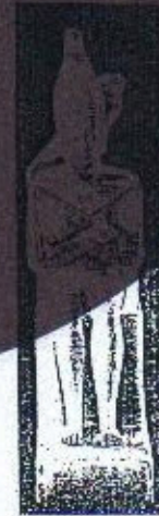
(٥) رحتسده الثالث